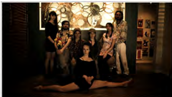
Schmuttland : pour une utopie durable.