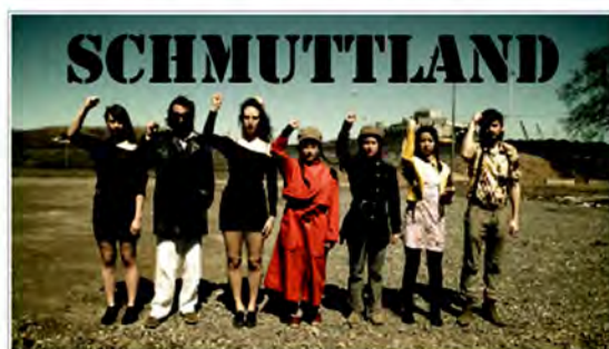
Schmuttland : pour une utopie durable.

9. Les sœurs Schmutt portant des masques à gaz dansent un slow debout sur la table à côté des convives.